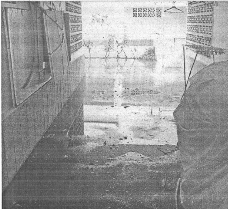
Las aguas inundan por completo las plantas bajas.

Agües 70 centímetros por debajo del nivel de la vía