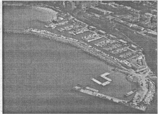
Estado actual de las obras de ampliación de Port Adriano.