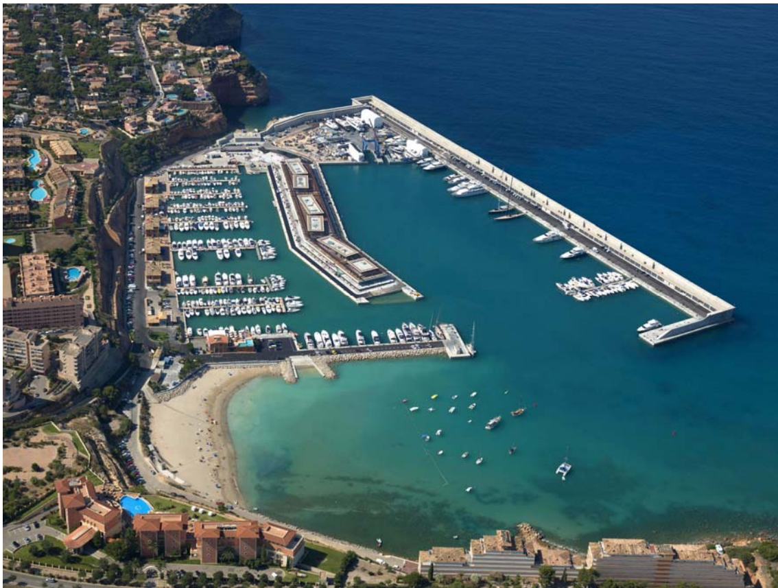
Imagen aérea de Port Adriano