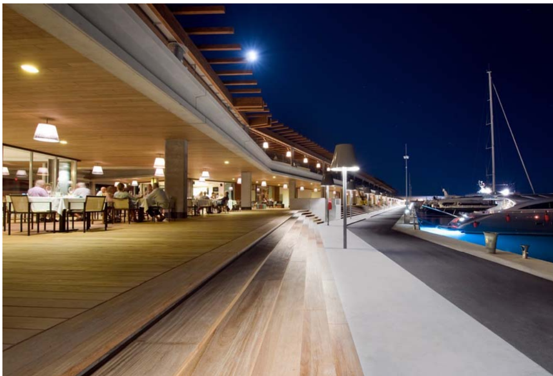
Zona comercial diseñada por Philippe Starck

Port Adriano cuenta con una zona comercial de 4.000m 2 y 40 locales, uno de los grandes atractivos del nuevo puerto. Prestigiosas empresas nacionales y extranjeras de náutica, moda, restauración y servicios abrirán este verano al público.