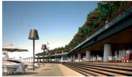
Philippe Starck 设计的游艇港内壮观的建筑之一

航海旅游是一个极具活力的行业，也是我们地区经济的支柱产业。我们都知道海洋最迷人的部分就是它的海岸，因此我们集团的目标就是为顾客们提供最齐全的港口设备和最顶级的娱乐设施。