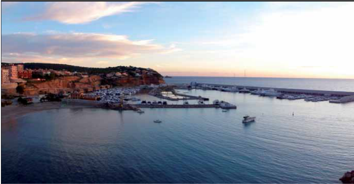
Port Adriano 游艇海港全景

在餐饮方面，我们没有复制马略卡岛已有的各色酒店餐厅，而是从一个新的角度来设计特色的餐饮。比如我们邀请了 East 和 Sansibar 这两家在德国极富盛名的饭店来我们游艇港开张分店，将是他们在德国本土外开张的第一家分店。