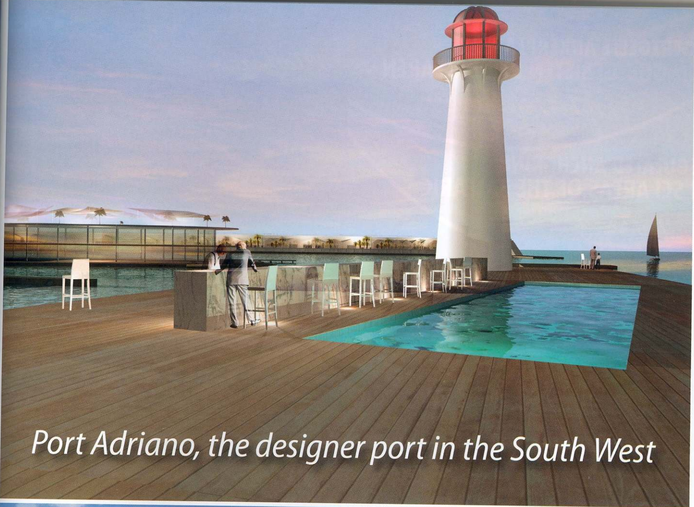
Port Adriano, the designer port in the South West