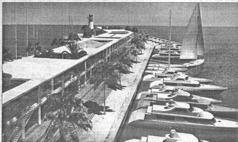
Imagen virtual de la zona comercial, diseñada por Philippe Starck.