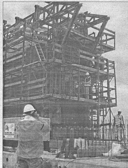
Los operarios trabajan en la creación del dique vertical.