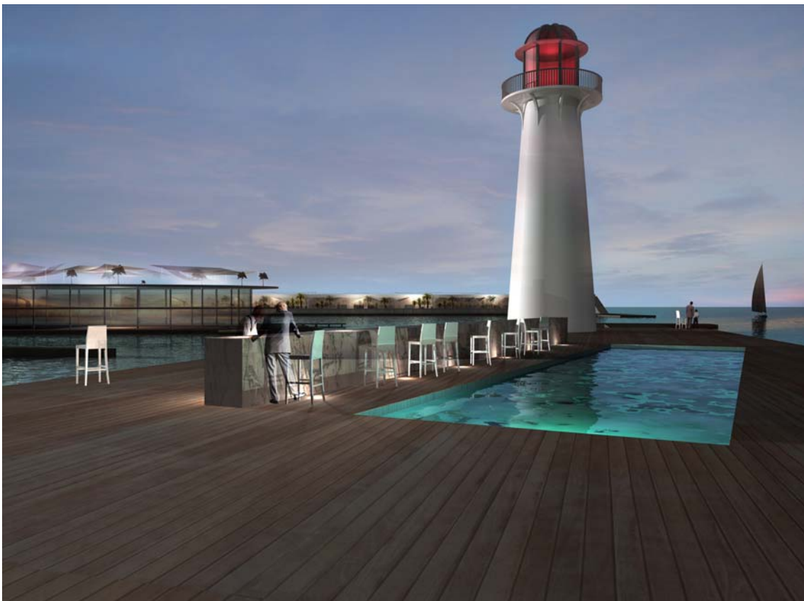
Proyecto futuro Port Adriano (Calvià, Mallorca). Faro.