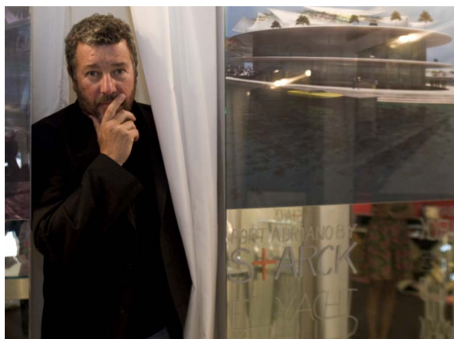
Philippe Starck junto a la maqueta del futuro Port Adriano (Mónaco Yatch Show, 20 Septiembre 2007)

El diseño de las zonas comunes y comerciales le ha sido encargado al prestigioso e internacionalmente reconocido diseñador francés Philippe Starck , quien redefinirá el tradicional concepto de este tipo de instalaciones, dando prioridad a la "vida" del puerto y a las personas, y ocultando la presencia de vehículos y barreras que impidan disfrutar del paisaje. Starck contará con la colaboración del arquitecto local Juan Morro, quien se ocupará de asegurar la adecuación al entorno.