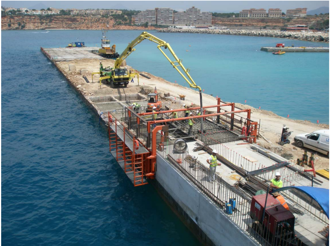
Fotos del encofrado del espaldón